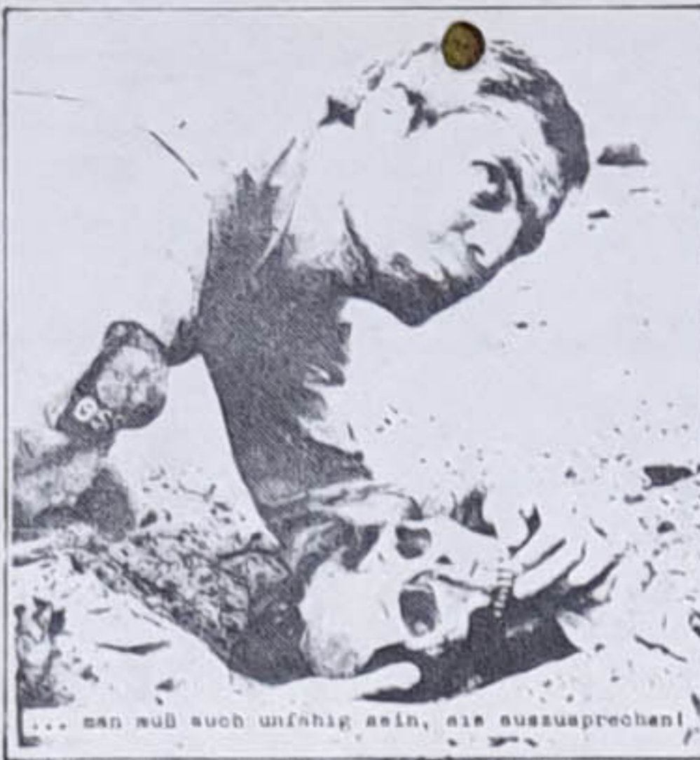
... man muß auch unfähig sein, sie auszusprechen!