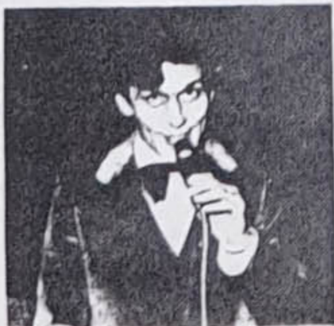
...meine damen und herren;