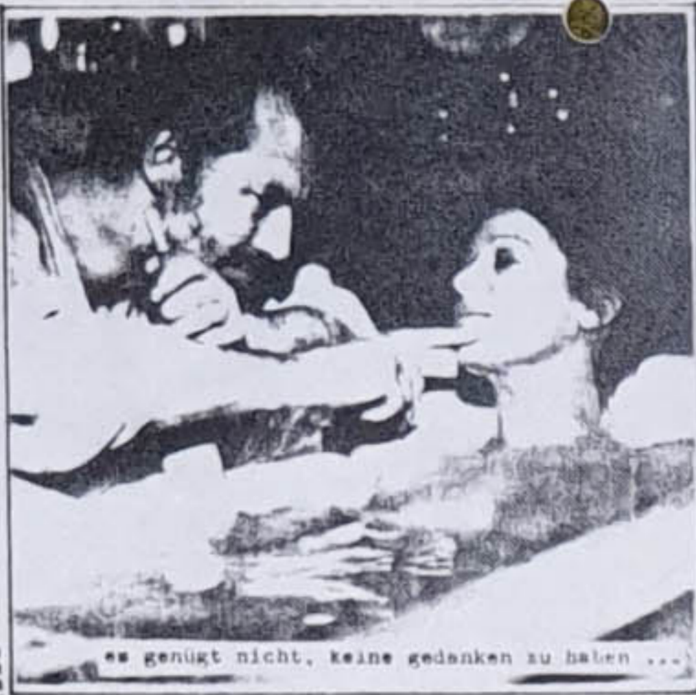
es genügt nicht, keine gedanken zu haben ...