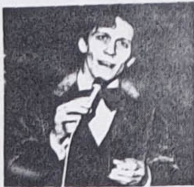
...liegt in ihren händen...