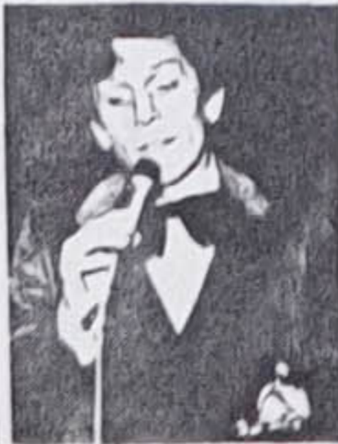
...greifen Sie zu und...