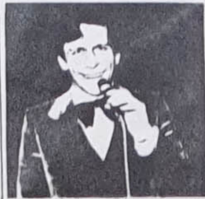
...ziehen Sie die fäden!